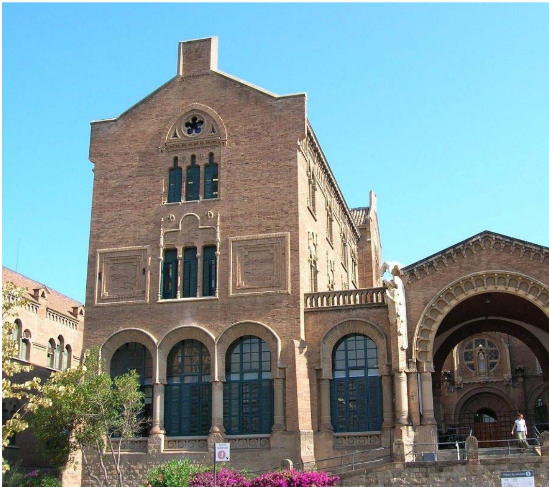
Imagen: Edificio donde se ubica el Centro de Investigación Cardiovascular (CSIC-ICCC) de Barcelona, el antiguo Convento del Hospital de la Santa Creu i Sant Pau.