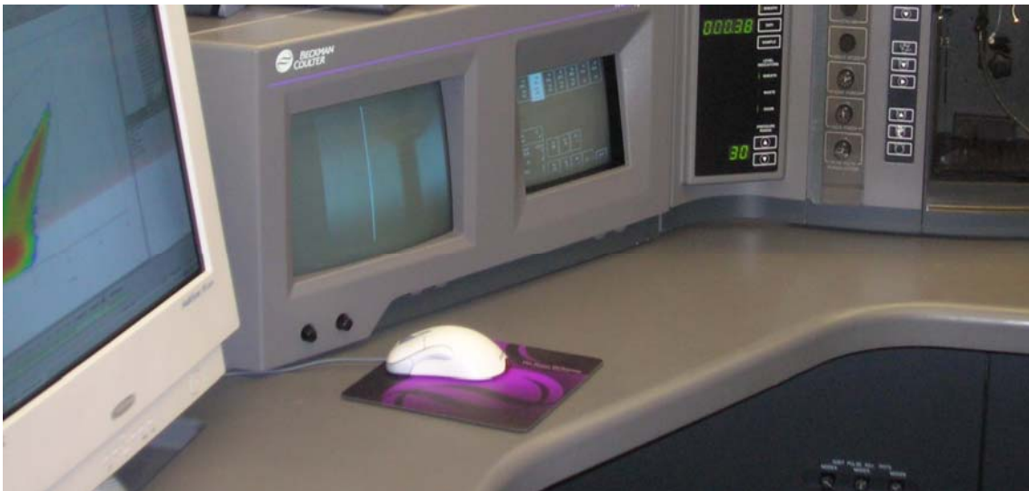
Imagen: Unidad de Citometría de Flujo. Sorter.

Los participantes serán estudiantes de primero y/o segundo de bachillerato en grupos de menos de 10 personas. En el taller, que tiene una duración de dos horas, los participantes podrán acercarse a las tecnologías más punteras en investigación cardiovascular que se está desarrollando en la actualidad.